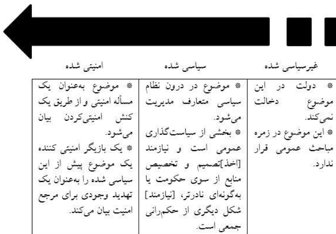
شکل ۱. طیف امنیتی کردن

می‌کند؟ ۱ تمرکز می‌شود» (Buzan & Wæver, 2003: 71).