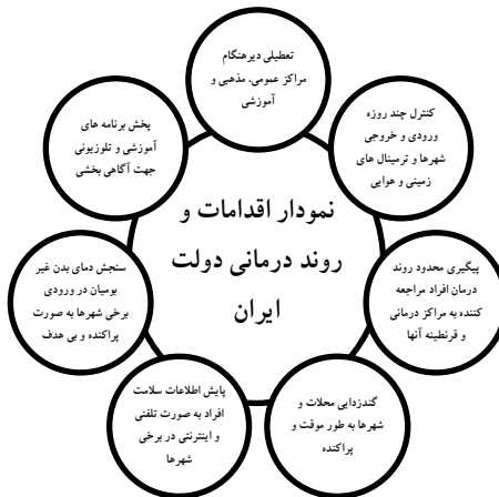
نمودار ۱. اقدامات و روند درمان کرونا در دولت ایران

این در حالی است که مدیریت بحران شاید سخت‌ترین آزمایش برای دولت‌ها باشد. این امر بویژه در مورد کووید ۱۹، از این رو صادق است که هیچ سابقه یا راه‌حل تاریخی قابل مقایسه‌ای ندارد و تهدید آن مدام در حال تحول است. فقط گذر زمان اثبات خواهد کرد که رهبران و مدیران جهان چقدر موفق عمل کرده‌اند و کدام استراتژی‌ها بهترین نتیجه را کسب کرده است (Glazer, 2020). این درحالی است که اقدامات دولت سنگاپور تا این زمان روشمند، با برنامه و حاصل اتحاد مسئولان این کشور است. مطالعه شیوه عمل و کنش دولت سنگاپور نشان می‌دهد که با تشخیص به موقع، پایش صحیح و هدفمند