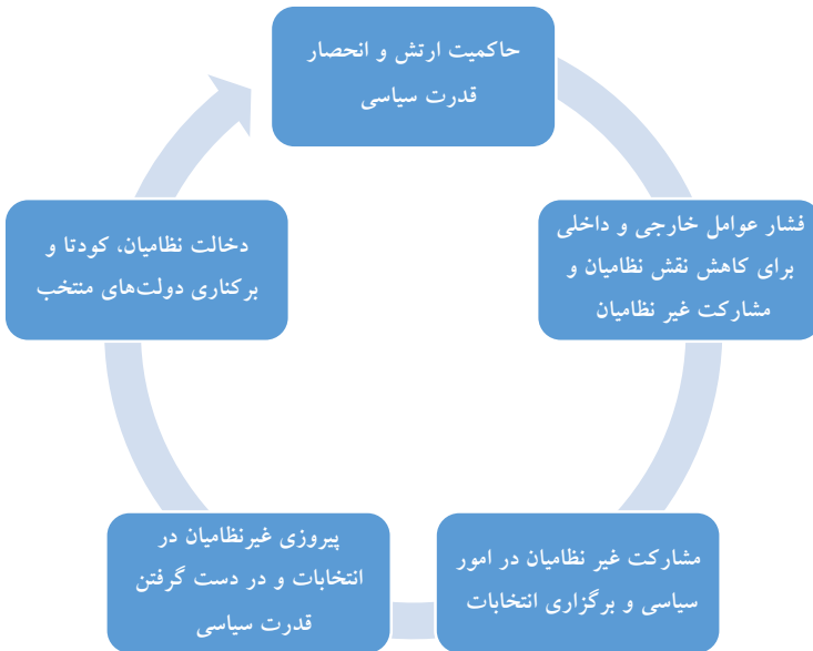
شکل ۱. چرخه تحول در سیاست داخلی