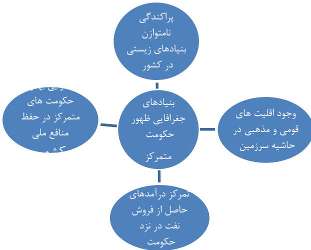
شکل ۴. بنیادهای جغرافیایی تداوم حکمرانی متمرکز در ایران

از سوی دیگر به دلیل موقعیت جغرافیایی از دیرباز فلات ایران از عمده‌ترین مسیرهای بوده است که آسیا، آفریقا و اروپا را به یکدیگر متصل نموده و از این جهت دارای موقعیت گذرگاهی بوده است (کامرون، ۱۳۶۵: ۷). بر این مبنا موقعیت جغرافیایی ایران در جنوب غرب آسیا از گذشته در اوضاع فرهنگی و سیاسی، در ظهور و پیدایش حکومت‌ها و سقوط آنها و بالاخره در تغییرات مرزهای ایران و در انبساط و انقباض مرزهای آن بسیار مؤثر بوده است. به طوری که در دوره‌های مختلف لشکرکشی قبایل و اقوام مجاور در جستجوی چراگاه‌ها و منابع زیستی و توسعه قلمرو پیاپی مرزهای کشور را تحت تأثیر قرار داده است. ایران به دلیل جایگاه ویژه و استراتژیک خود، یعنی وصل دو قاره آسیا و اروپا و وجود خلیج فارس در جنوب آن، زمینه را برای گسترش مناسبات تجاری، اقتصادی، فرهنگی، اجتماعی و قومی فراهم کرده است و در نقطه مقابل مورد تهاجم و تاخت و تاز قدرت‌ها و اقوام مختلف نیز بوده است (آل غفور، ۱۳۸۱: ۲۸). در این راستا موقعیت جغرافیایی حائل ایران مابین