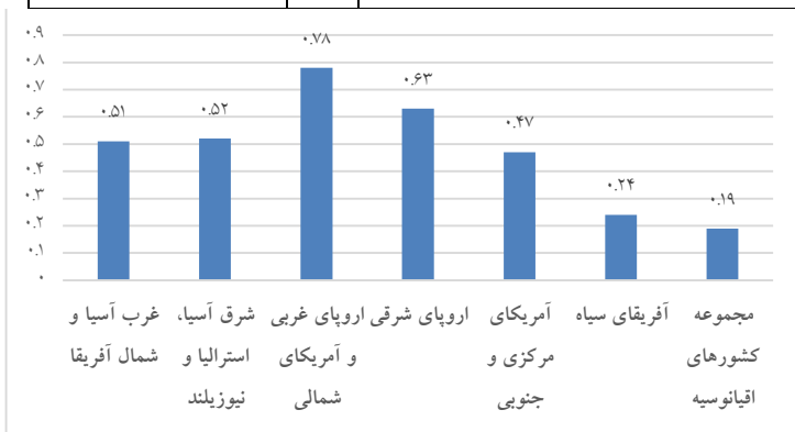
نمودار ۱. میانگین نمره شاخص خدمات آنلاین در مناطق مختلف جهان

آزمون آنالیز واریانس یکطرفه نشان می‌دهد که میانگین نمره‌ی شاخص خدمات آنلاین بین مناطق مختلف جهان تفاوت معنادار دارد ( P < ۰/۰۰۱ ).